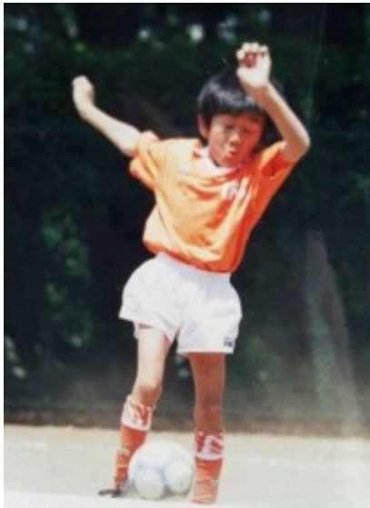
横浜市長杯少年サッカー大会決勝トーナメント (本誌印刷)